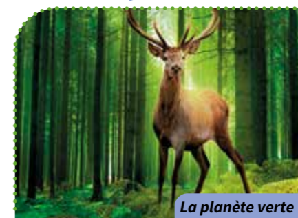
La planète verte

Gut Où? Résidence Gutenberg Quand? À 14 h 30 Combien ça coûte? 2,10 € Comment? Inscriptions et renseignements au 02.47.37.03.22