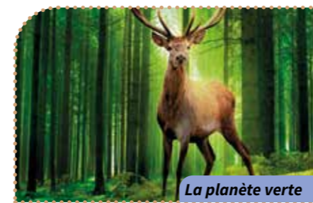
La planète verte

Sp Où ? Résidence Saint-Paul Quand ? À 14 h 30