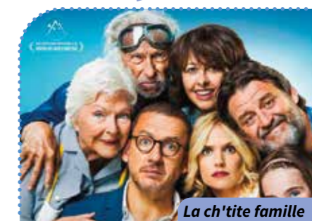
La ch'tite famille

Gut Où ? Résidence Gutenberg Quand ? À 14 h 30