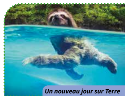
Un nouveau jour sur Terre

An Où? Résidence Arche des Noyers Quand? À 14 h 30 Combien ça coûte? 2,10 € Comment? Inscriptions et renseignements au 02.47.41.64.80