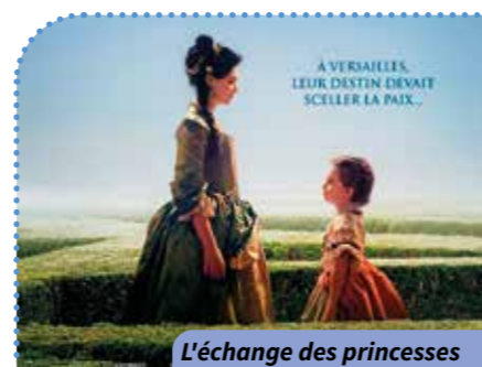
L'échange des princesses

An Où ? Résidence Arche des Noyers Quand ? À 14 h 30