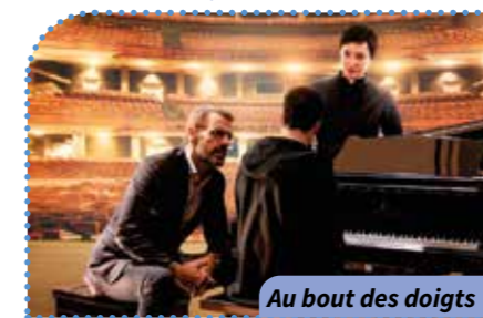
Au bout des doigts

St Sp Où ? Résidence Saint-Paul Quand ? À 14 h 30