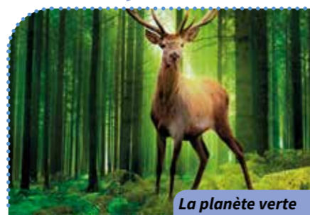
La planète verte

Alb Où ? Résidence Albatros Quand ? À 14 h 30