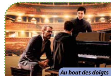
Au bout des doigts

Alb Où? Résidence Albatros Quand? À 14 h 30 Combien ça coûte? 2,10 € Comment? Inscriptions et renseignements au 02.47.28.62.32