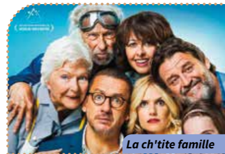
La ch'tite famille

Alb Où ? Résidence Albatros Quand ? À 14 h 30