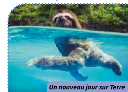
Un nouveau jour sur Terre

Pas Où ? Résidence Pasteur Quand ? À 14 h 30