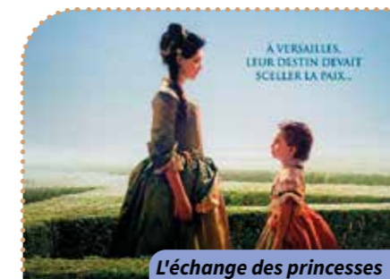
L'échange des princesses

Pas Où ? Résidence Pasteur Quand ? À 14 h 30