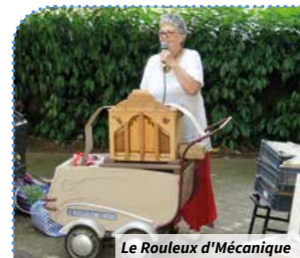
Le Rouleux d'Mécanique

Alb Où ? Résidence Albatros Quand ? À 15 h Animé par ? Le Rouleux d'Mécanique Combien ça coûte ? 4,15 € Comment ? Inscriptions et renseignements au 02.47.28.62.32