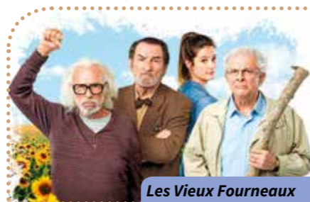
Les Vieux Fourneaux

St Paul Où ? Résidence Saint-Paul Quand ? À 14 h 30 Combien ça coûte ? 2,10 € Comment ? Inscriptions et renseignements au 02.47.05.56.12