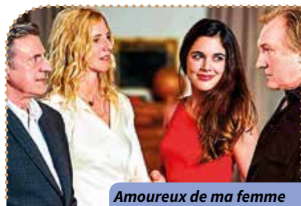
Amoureux de ma femme

Alb Où ? Résidence Albatros Quand ? À 14 h 30 Combien ça coûte ? 2,10 € Comment ? Inscriptions et renseignements au 02.47.28.62.32