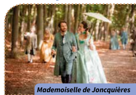
Mademoiselle de Jonquières

Pas Où ? Résidence Pasteur Quand ? À 14 h 30 Combien ça coûte ? 2,10 € Comment ? Inscriptions et renseignements au 02.47.66.67.04