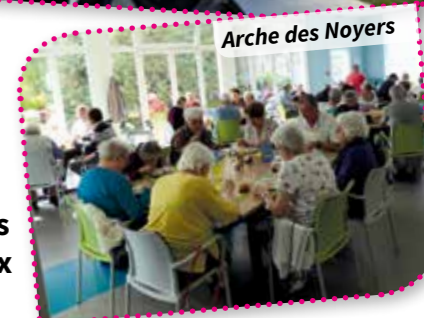
Arche des Noyers