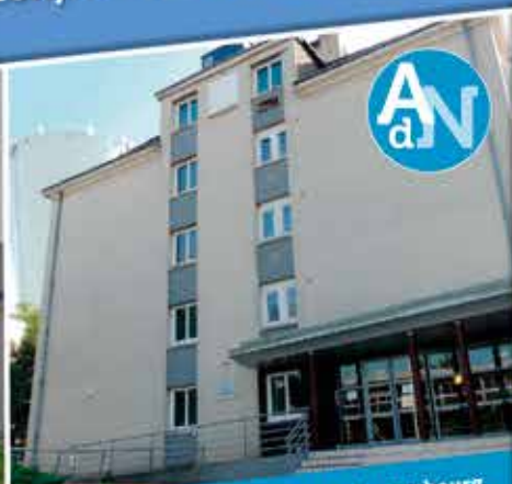
AN « Arche des Noyers » | 10, rue du Luxembourg