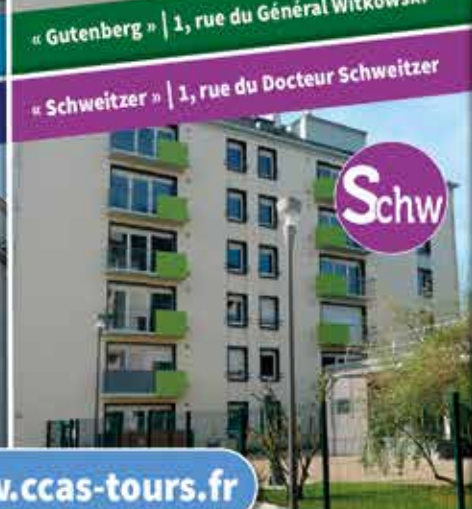
Schw « Schweitzer » | 1, rue du Docteur Schweitzer