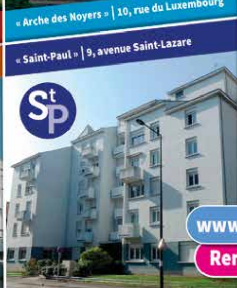
St P « Saint-Paul » | 9, avenue Saint-Lazare