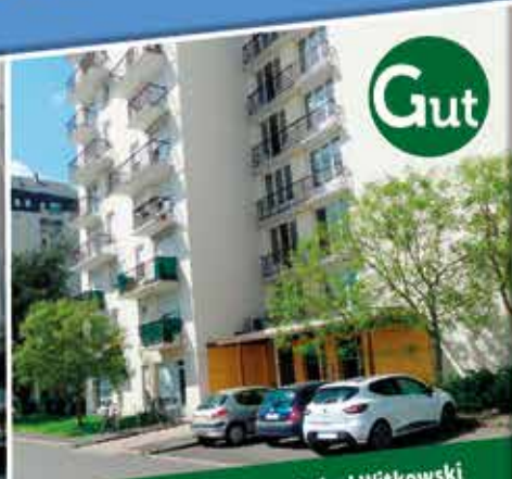
Gut « Gutenberg » | 1, rue du Général Witkowski