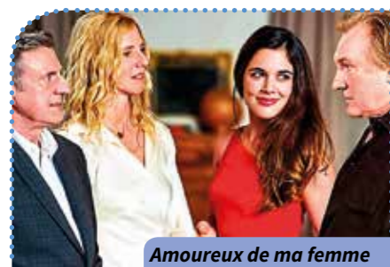
Amoureux de ma femme

AN Où ? Résidence Arche des Noyers Quand ? À 14 h 30 Combien ça coûte ? 2,10 € Comment ? Inscriptions et renseignements au 02.47.41.64.80