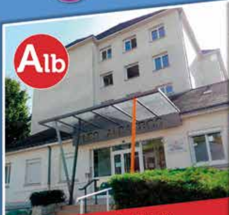
Alb « Les Albatros » | 1, rue de Saussure