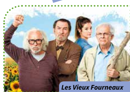
Les Vieux Fourneaux

Aib Où ? Résidence Albatros Quand ? À 14 h 30 Combien ça coûte ? 2,10 € Comment ? Inscriptions et renseignements au 02.47.28.62.32