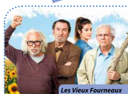
Les Vieux Fourneaux

Gut Où ? Résidence Gutenberg Quand ? À 14 h 30 Combien ça coûte ? 2,10 € Comment ? Inscriptions et renseignements au 02.47.37.03.22