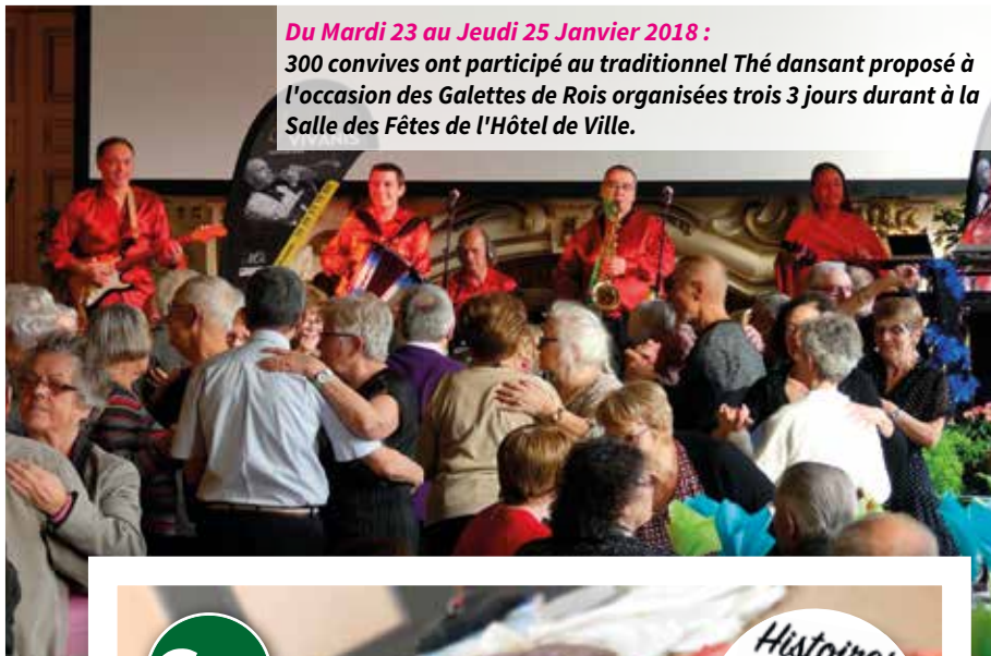
Du Mardi 23 au Jeudi 25 Janvier 2018 : 300 convives ont participé au traditionnel Thé dansant proposé à l'occasion des Galettes de Rois organisées trois 3 jours durant à la Salle des Fêtes de l'Hôtel de Ville.