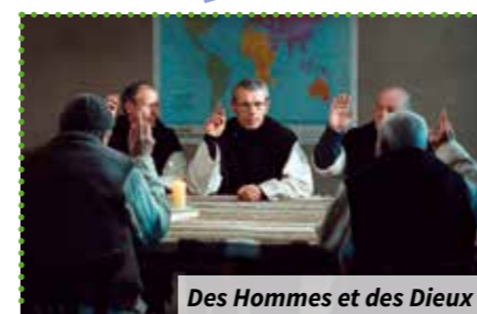
Des Hommes et des Dieux

Schw Où ? Résidence Schweitzer Quand ? À 14 h 30 Combien ça coûte ? 2,05 € Comment ? Inscriptions et renseignements au 02.47.46.19.35