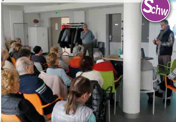
Vendredi 16 Février 2018 : "Entretenir sa forme et son équilibre, c'est pouvoir mener une vie autonome et se déplacer sans avoir peur de tomber !" Conférence d'informations sur la prévention des chutes par Kinesis Formation.