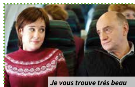
Je vous trouve très beau

Gut Où ? Résidence Gutenberg Quand ? À 14 h 30 Combien ça coûte ? 2,05 € Comment ? Inscriptions et renseignements au 02.47.37.03.22