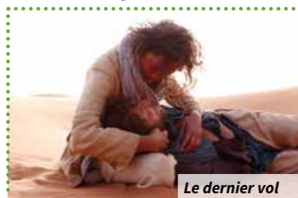
Le dernier vol

Pas Où ? Résidence Pasteur Quand ? À 14 h 30 Combien ça coûte ? 2,05 € Comment ? Inscriptions et renseignements au 02.47.66.67.04